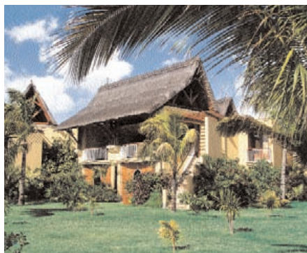
Paradis Hotel & Golfclub.

In den Juniorsuiten dominiert Maritimes. Die Schattierungen des Strandes und des Meeres variieren von dunkel- zu hellblau, während liches Gelb in sanftes Beige wechselt. Weiche, gemütliche Couches und Rattansessel laden zu faulen Lesennachmittagen ein. Alle Suiten besitzen große Terrassen und weitläufige, lichte Badezimmer. Der Blick aufs Meer ist garantiert, und modernste Technik gehört zum Standard.