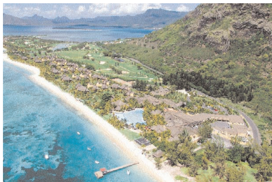
Das Dinarobin Hotel Spa & Golf direkt am Indischen Ozean.

Mauritius Infobüro www.mauritius.net ; mauritius@gcihsf.de