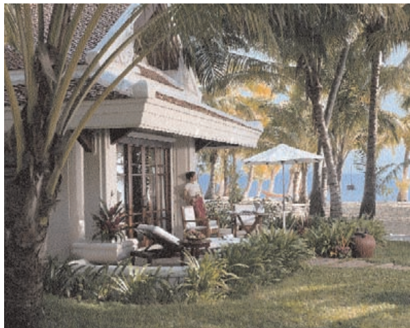
Im Santiburi Resort mit seinen luxuriösen Villen findet der Gast Ruhe und Entspannung pur.

Denkt man an Thailand, denkt man immer auch an die einzigartige Küche, die im Santiburi Resort zu höchster Vollendung findet. Gemüse, Kräuter und Gewürze werden servierfrisch im hoteleigenen Garten geerntet.