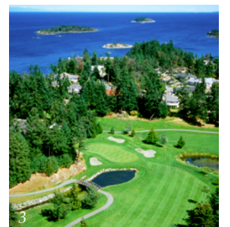
1: Hoyo 18 del Westin Bear Mountain Victoria Resort & Spa ; 2: Pheasant Glen Golf Resort ; 3: Hoyo 2 del Fairwinds Schooner Cove Resort . (1 y 2: Par 7 ; 3, cort: Fairwinds )