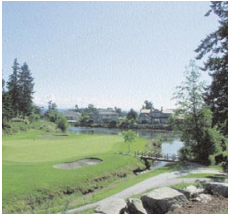
Der Fairwinds Golf Club zählt zu den Traditions Clubs der Insel. Das 2. Green zählt ...

gesorgt. Diese Anlage ist ein würdiger Auftakt für eine Vancouver Island Golf-Tour.