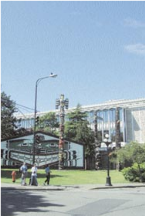
Victoria – Museum und Daily-Life dicht beieinander

Charakteristische Merkmale dieses fast naturbelassenen Terrains sind 12 Seen und zwei Wasserfälle, optisch eine Augenweide und golferisch exzellente Herausforderungen. So wie in allen kanadischen Golf Clubs ist auch hier das Clubhaus ein sehr angenehmes Refugium, in dem sich der Gast gerne nach oder auch schon vor der Runde zum Essen oder Frühstück aufhält. Freundlichkeit und Gastlichkeit wird überall in den Vordergrund gestellt.