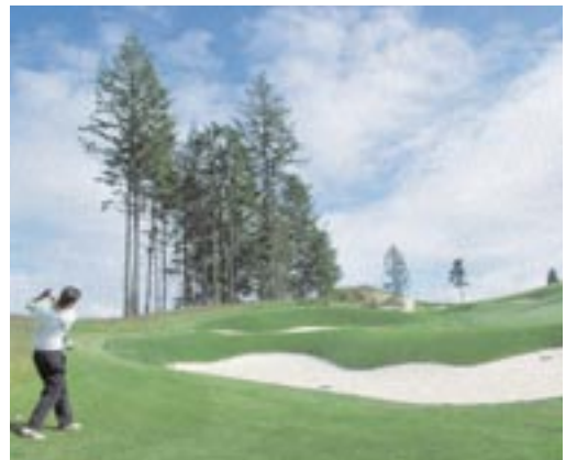
Ein sauberer Schlag auf das Green ist hier eine herausfordernde Schwierigkeit.