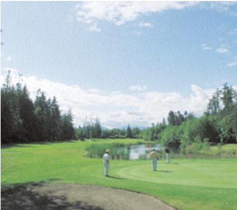
Der Morningstar Championship Golf Course ist ein golferischer Leckerbissen und ...