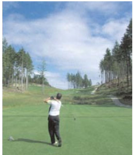
Ein langer präziser Tee Shot ist am 14. Loch erforderlich, um ein Par oder gar ein Birdie zu erzielen.