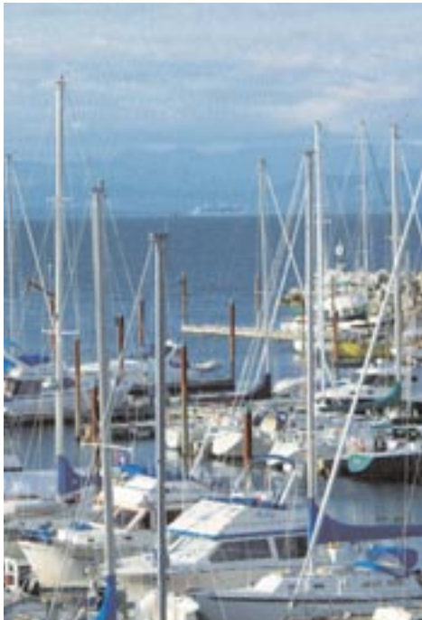
Das Fairwinds Schooner Cove Hotel & Marina liegt direkt am Hafen und eröffnet einen weiten Blick auf das Meer und die Luxus-Liner, deren Ziel Alaska ist.