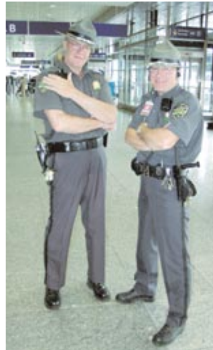
Canadien Policemen – immer freundliche Helfer.