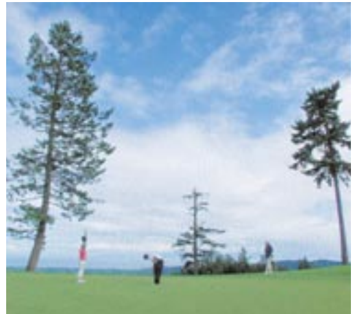
Genussvolles Putten auf dem 14. Green zum Birdie, Par, Bogey oder gar Doppel-Bogey!!!!???