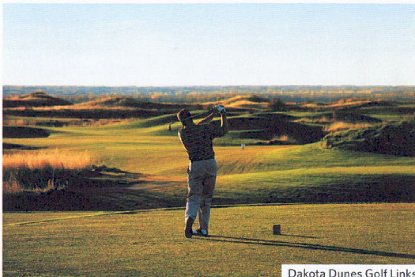
Dakota Dunes Golf Links