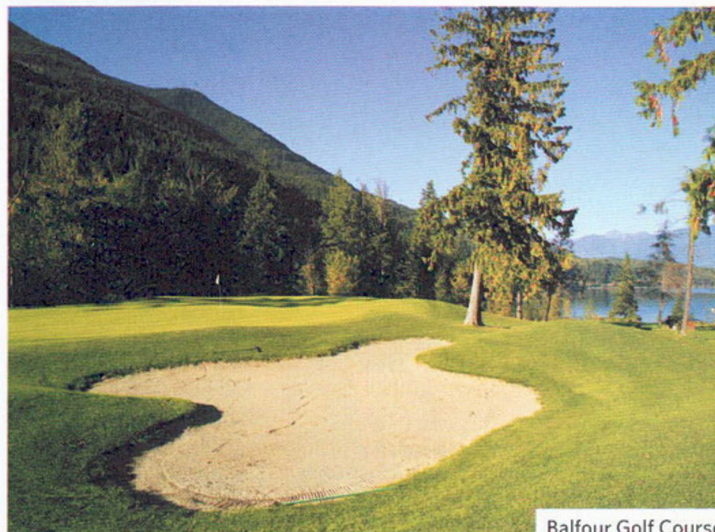
Balfour Golf Course

Not only are courses here open year-round, you'll also find an embarrassment of superlative affordable courses. In Victoria, spots like Bear Mountain and Olympic View are well known, but the true golf Shangri-La is mid-island at Top 100 contenders like Storey Creek and the resort-style Crown Isle. Around golf-rich Nanaimo, the Les Furber triumph Morningstar Championship Golf combines fairways and driveways for a course that can't be beat. Developers everywhere, take note. In the Cowichan Valley, the quirky Duncan Meadows mixes links and parklands to excellent effect. And the hillside-traditional Nanaimo Golf Club plays like a July afternoon - even after a West Coast monsoon. ➤ En matière de parcours superbes, abordables et ouverts toute l'année, on a ici l'embarras du choix. Le Bear Mountain et l'Olympic View, à Victoria, sont bien connus, mais le véritable paradis des golfeurs est ailleurs, au cœur de l'île, là où le Storey Creek et le Crown Isle (un golf de villégiature) ont déjà fait partie des 100 meilleurs parcours au pays. Près de Nanaimo, ville bien pourvue en golfs, les allées du Morningstar Championship Golf, petit bijou de Les Furber, sont serties parmi celles des résidents de Parksville. Dans la vallée du Cowichan, le capricieux Duncan Meadows se fond dans un immense parc. Et au Nanaimo Golf Club, même après de fortes pluies, on joue toujours comme si l'on était en juillet.