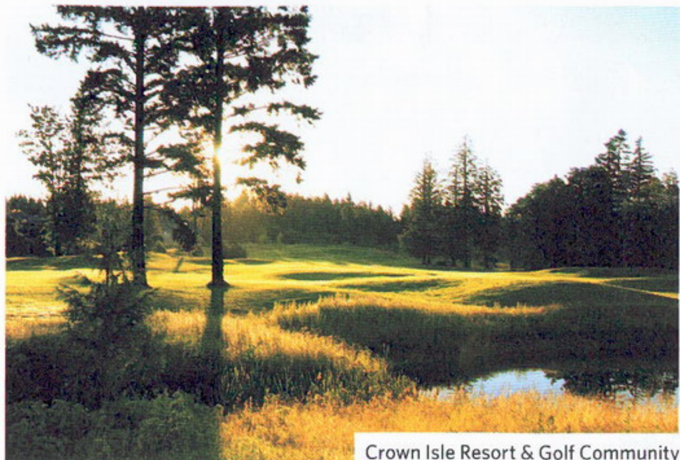
Crown Isle Resort & Golf Community